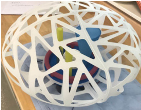
Tank als 3D-Ausdruck Typisches Produkt von Röchling: Tank für Wasser- einspritzung

Um durch die Verwendung nicht freigegebener Unterlagen entstehende Fehler zu vermeiden, werden die 3D-PDFs mit einem digitalen Wasserzeichen bestempelt. Es gibt Auskunft über ihren Status und bleibt auch beim Drucken, Kopieren oder Versenden per E-Mail erhalten. Ändert sich der Status, muss das Produktdatenblatt nicht neu erzeugt, sondern nur der Stempel aktualisiert oder – nach der Freigabe – ganz entfernt werden. Die digitale Stempelfunktion